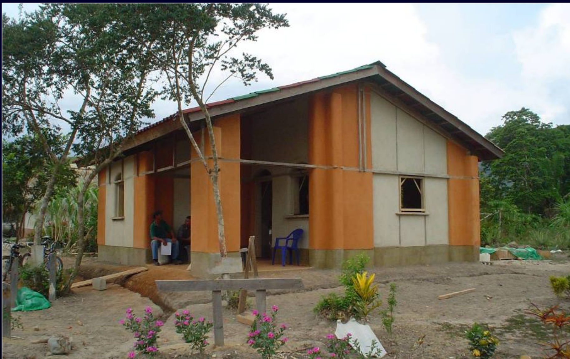
Una lectura facil del edificio : sistema constructivo visible.