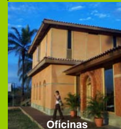
Oficinas FSAR TOCOA

Financiamiento: MISEREOR. Ejecución: FSAR