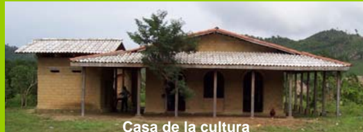
Casa de la cultura