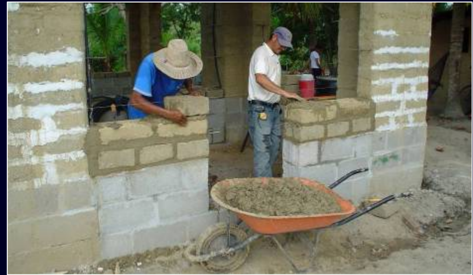
Etapa 2 : muros de relleno en adobe y bahareque.