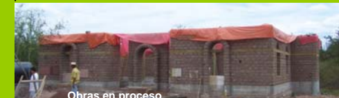
Obras en proceso

Financiamiento: MISEREOR. Ejecución: FSAR