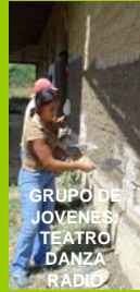
GRUPO DE JOVENES TEATRO DANZA RADIO