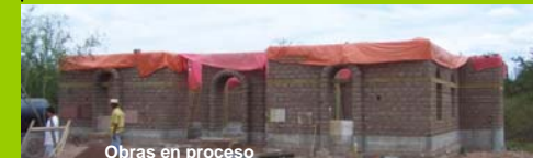
Obras en proceso

Financiamiento: MISEREOR. Ejecución: FSAR