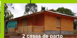
2 casas de parto

Financiamiento: MISEREOR. Ejecución: FSAR y cooperativa