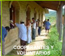
COOPERANTES Y VOLUNTARIOS