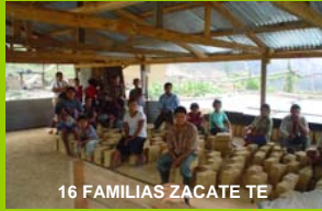
16 FAMILIAS ZACATE TE