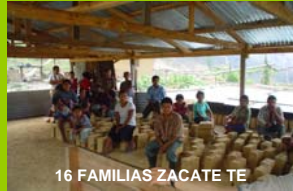
16 FAMILIAS ZACATE TE