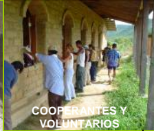
COOPERANTES Y VOLUNTARIOS