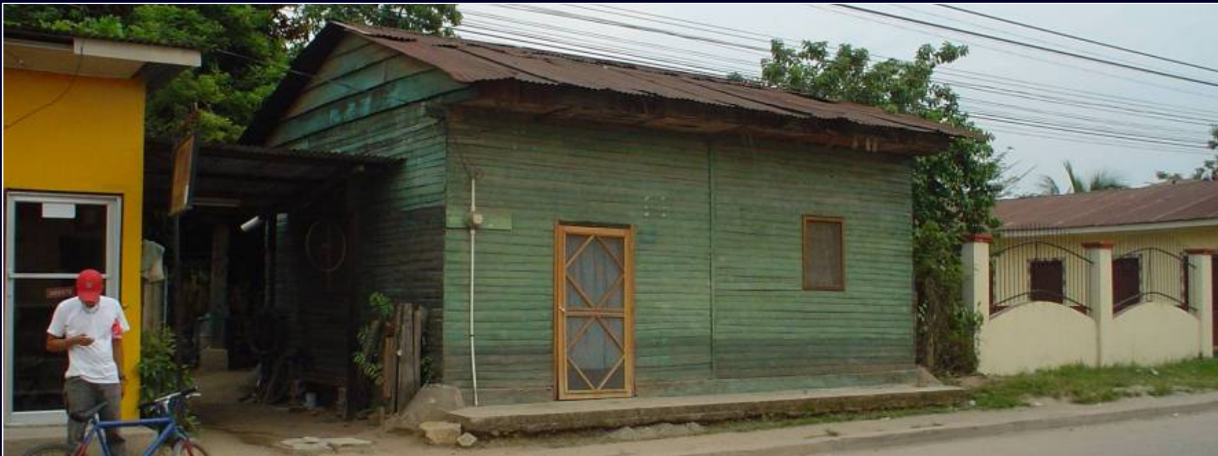
La yagua : una madera en via de extincion.