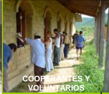
COOPERANTES Y VOLUNTARIOS