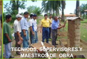
TECNICOS, SUPERVISORES Y MAESTROS DE OBRA

PROYECTO ZACATE TE "construir comunidad" Tribu El Pate, Yoro Honduras