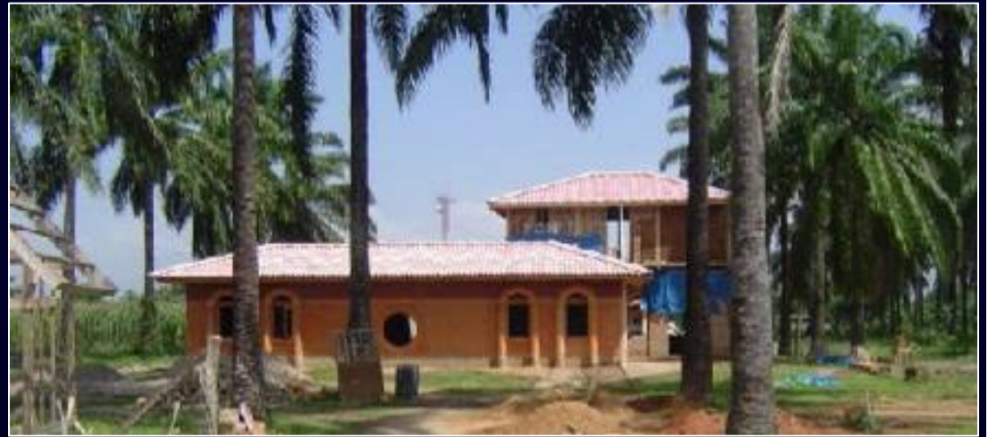
Dimensiones oficiales de planta para una aula