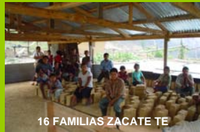
16 FAMILIAS ZACATE TE