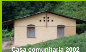
Casa comunitaria 2002