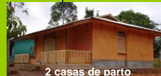
2 casas de parto MEDICOS DEL MUNDO

Financiamiento: MISEREOR. Ejecución: FSAR y cooperativa