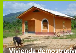
Vivienda demostrativa CTSAR TOCOA

Financiamiento: MISEREOR Ejecución: CTSAR