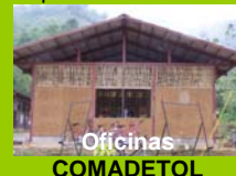
Oficinas COMADETOL EL TIGRE

Financiamiento: MISEREOR 15 y TROCAIRE 58 Ejecución: CTSAR