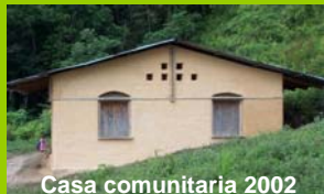
Casa comunitaria 2002