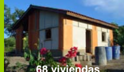
68 viviendas Beneficiarios

Financiamiento: MISEREOR Ejecución: CTSAR