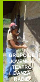
GRUPO DE JOVENES TEATRO DANZA RADIO