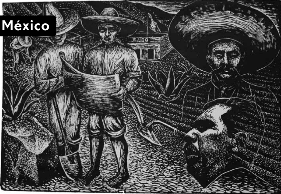
Lázaro Cárdenas y la reforma agraria, pintura de Luis Arenal. Tomado de < http://www.museoblaisten.com/v2008/hugePainting.asp?numID=951 >