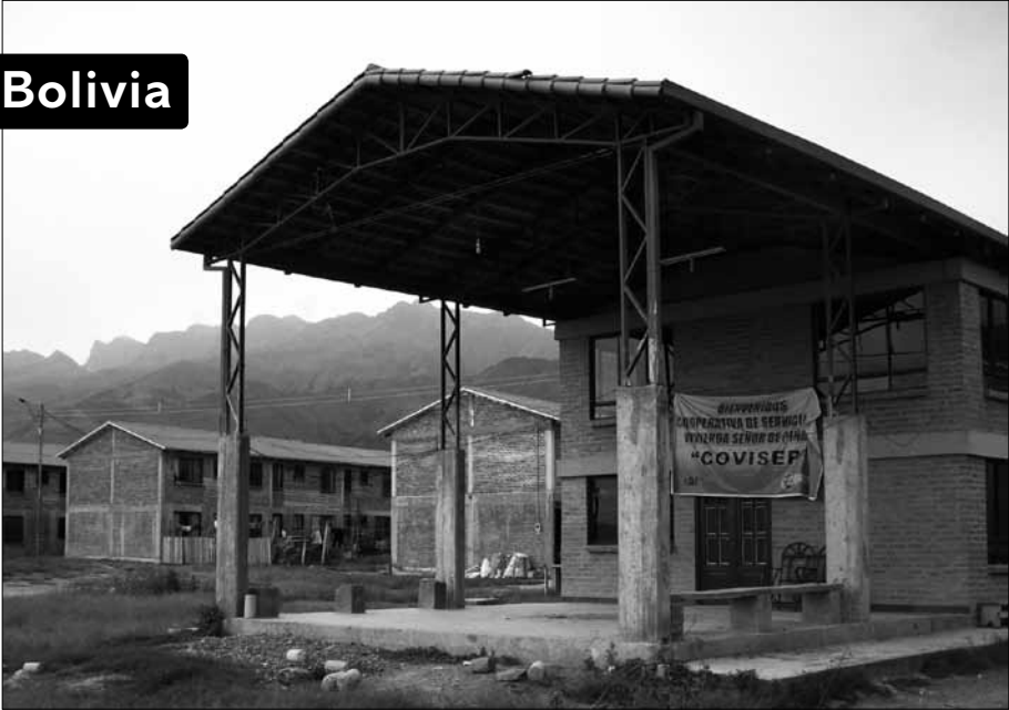
Viviendas y salón comunal de la Cooperativa de propiedad colectiva «Señor de Piñami» (Cochabamba)