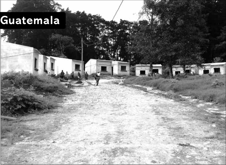
Cooperativa de propiedad colectiva Fe y Esperanza, en San Pedro Sacatepéquez, Guatemala. Primeras ocho casas de un proyecto de veintiuna, apretaditas en un racimo, como las familias en la cooperativa