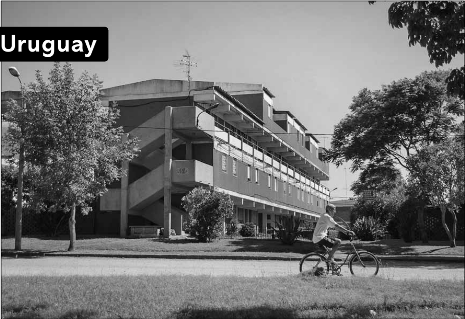
Complejo «José Pedro Varela» (1.657 viviendas), proyecto intercooperativo de ayuda mutua y propiedad colectiva; terrenos otorgados por el Estado (comienzos años setenta).