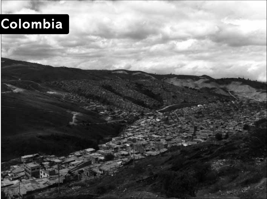
La ciudad y sus muchos rostros