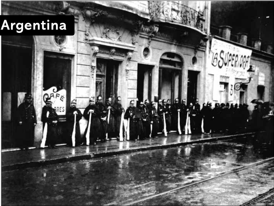
Represión durante la Huelga de Inquilinos o «Huelga de las Escobas» de 1907, protagonizada fundamentalmente por las mujeres de las familias. Foto de la revista Caras y Caretas , 1907