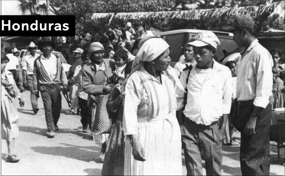
Manifestación de indígenas lenkas, quienes desde siempre conservan sus tierras en propiedad colectiva.