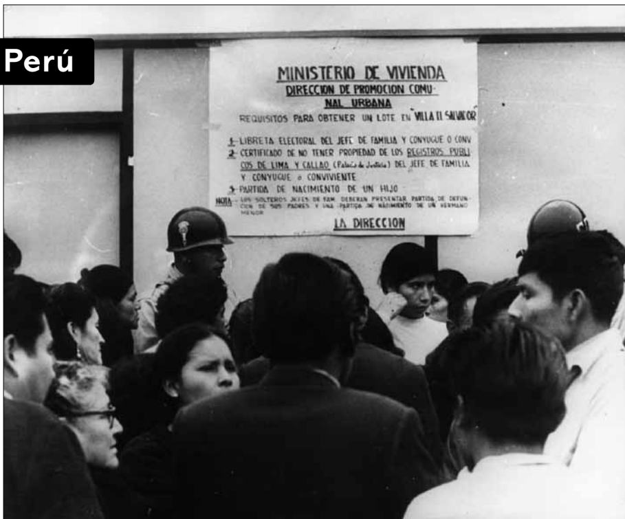
Esperando a la Esperanza