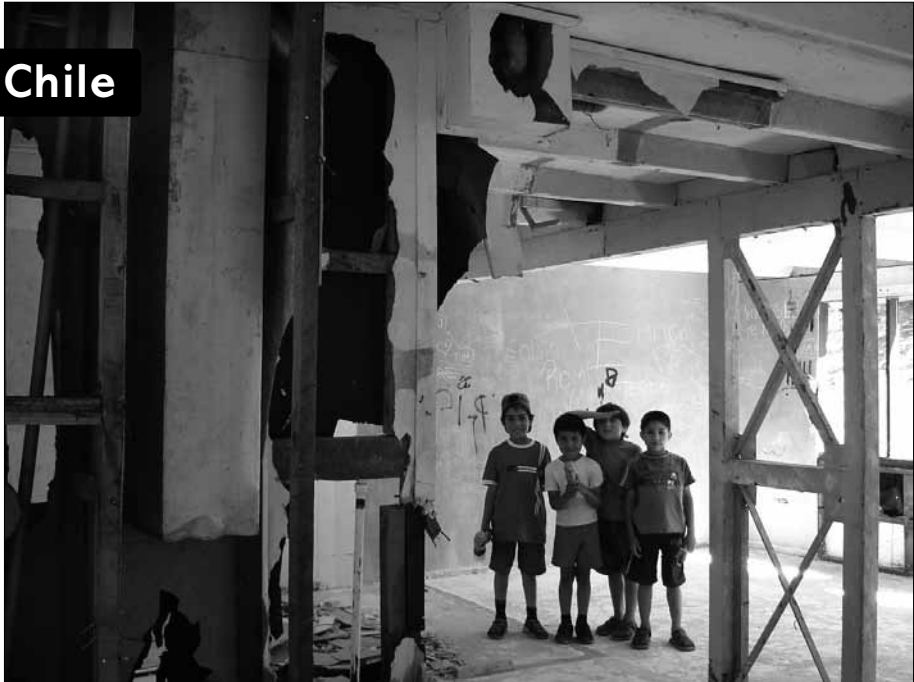
Propiedad individual de conjuntos colectivos.