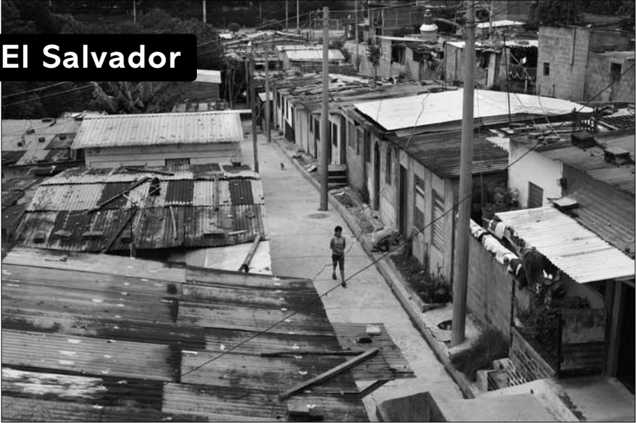
Soyapango. La ciudad que hace la gente