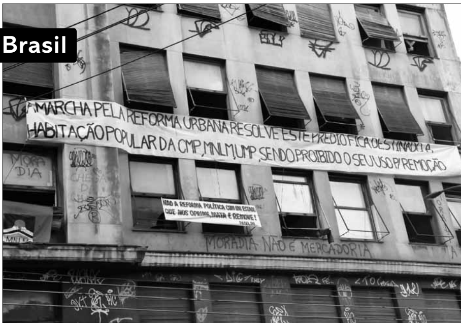
La batalla por el Derecho a la Ciudad